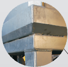
warga okapowa, pojemność 38L