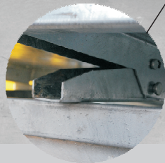
bezobstugowy system otwierania